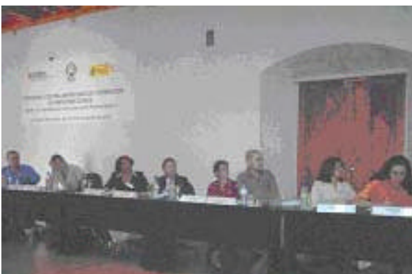
Seminario Emprendedor, Antigua Guatemala

Además, se ha procurado que en cada reunión oficial de los proyectos y en todas las comunicaciones esté presente un banner con el logotipo del Gobierno de Aragón. Otro logro es que el programa ha sido incluido en una investigación realizada por la GTZ sobre los programas de apoyo a la microempresa a nivel nacional.