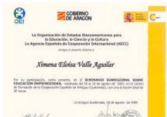
Diploma seminario emprendedor