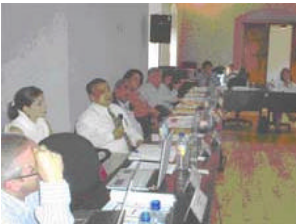
El grupo asistente al seminario emprendedor escucha una de las exposiciones magistrales

Respecto a lo anterior, los participantes expresaron su satisfacción ante la calidad del seminario; de las ponencias y de los resultados de los grupos de trabajo y se comprometieron a dar seguimiento a las acciones y a promover programas de formación emprendedora desde sus respectivas instituciones.