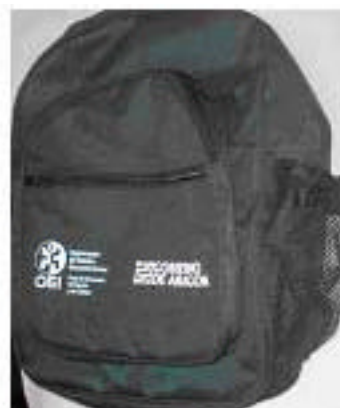
Bolso para facilitadores del programa